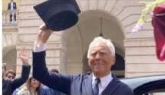
Proposta di dedicare l'Istituto Comprensivo allo stilista scomparso Giorgio Armani

Benvenuti all'Istituto scolastico «Giorgio Armani». Per la verità l'intitolazione è rimasta sulla carta anzi, nelle intenzioni di un gruppo di insegnanti che ha avanzato proposta al collegio docenti, sollevando un polverone. Nel paese delle griffe anche la scuola dunque strizza l'occhio ai brand, ma stavolta la faccenda non è finita così pacificamente: e mentre il sindaco recentemente ha dovuto mettere mano all'incalzante partnership di firme negli stabilimenti balneari, l'ambiente scolastico ha raschiato al suo interno la questione. Nella riunione tra i professori sarebbero infatti assai alzati i toni sulla richiesta di dedicare allo stilista scomparso l'Istituto scolastico Forte dei Marmi, tanto da chiudere l'infiammato confronto con le votazioni di rito che hanno visto 40 insegnanti pro l'idea e solo 19 a favore. Per la verità sul tavolo del colle-